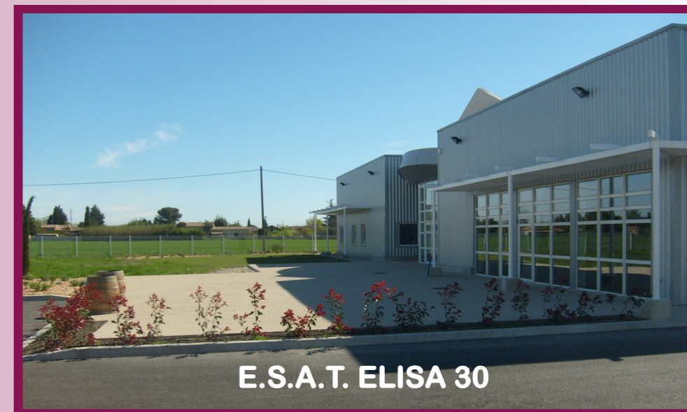
E.S.A.T. ELISA 30

Conformément à la loi du 11 février 2005 article 39 et aux articles L. 344-1-1, L. 344-2 et L. 344-2-1 du code de l'action sociale et des familles. Les ESAT doivent assurer à chaque usager un soutien médico-social permettant le développement de leurs potentialités et des acquisitions nouvelles, tant par des actions d'entretien des connaissances, de maintien des acquis scolaires, de formation professionnelle et des actions éducatives d'accès à l'autonomie et d'implication dans la vie sociale. Ceci à leur bénéfice et dans un milieu de vie favorisant leur épanouissement personnel et social.